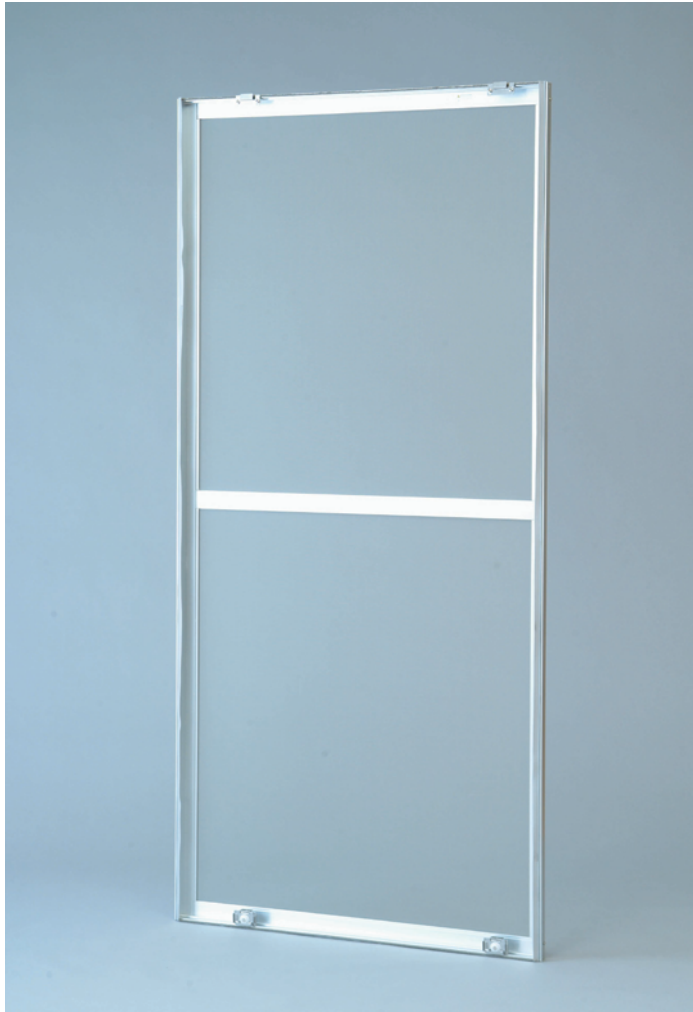
(内観右側のみで使用可能)